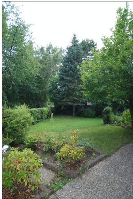
Blick in den schön eingewachsenen Garten