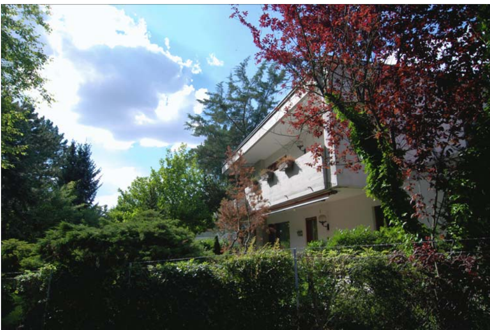
Blick von der Seite auf die Rückseite des Hauses