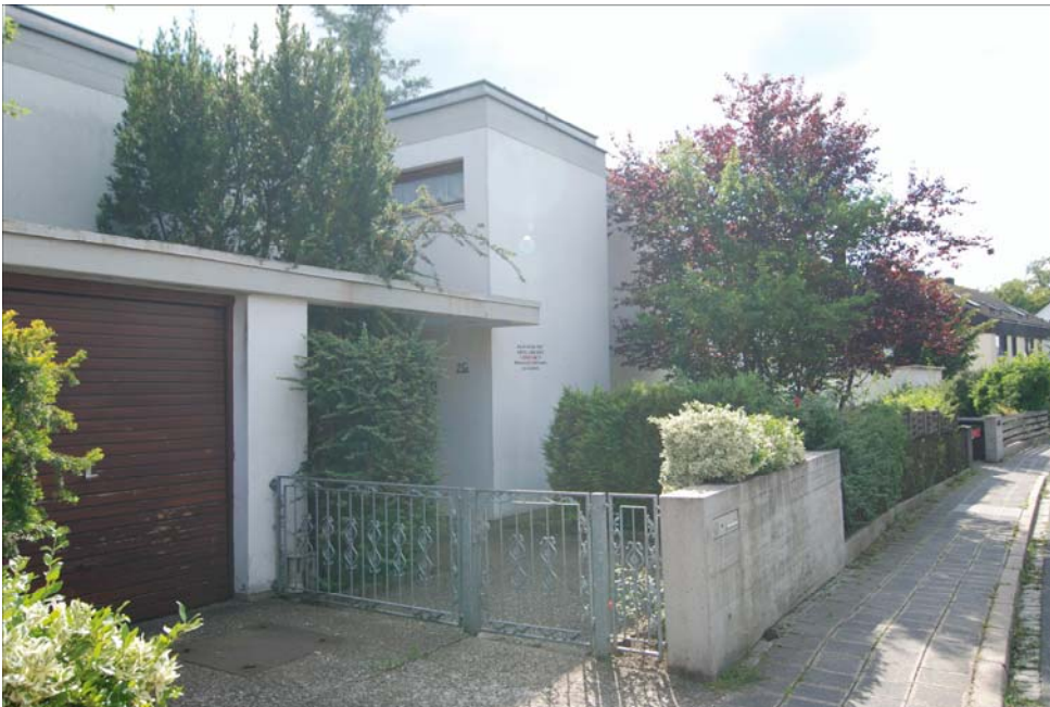
Blick auf den Eingangsbereich und Garage