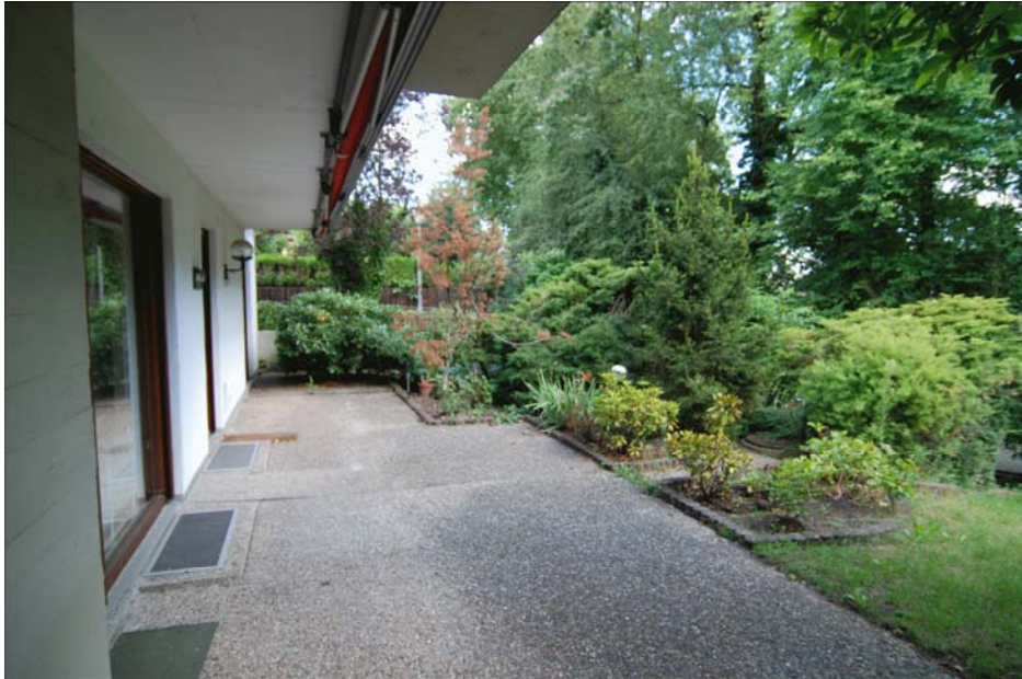
Blick auf die Terrasse